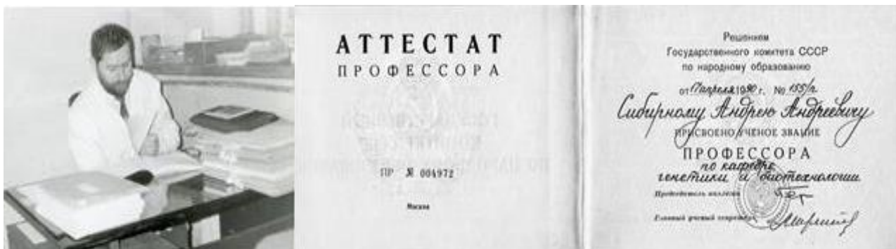
Фото 6. Професор кафедри генетики і біотехнології Львівського національного університету імені Івана Франка (1988–1993 рр.).

федри генетики і біотехнології Львівського національного університету ім. Івана Франка. У 1990 р. отримав вчене звання професора цієї кафедри (фото 6).