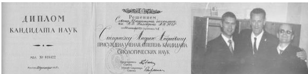
Фото 3. Диплом кандидата біологічних наук за спеціальністю «Біохімія», 1973 р. Разом з опонентом проф. Сухомліновим Б. Ф. та д.б.н. Коробовим В.

ринів у дріжджів Pichia guilliermondii і деякі аспекти його регуляції» за спеціальністю «Біохімія» (фото 3, 4).