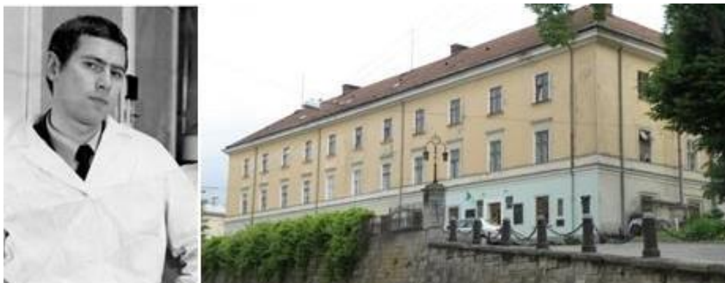
Фото 1. Біологічний факультет Львівського національного університету імені Івана Франка (1965–1970 рр). Спеціальність: Біологія-Мікробіологія. Кваліфікація: Біолог, викладач біології і хімії.