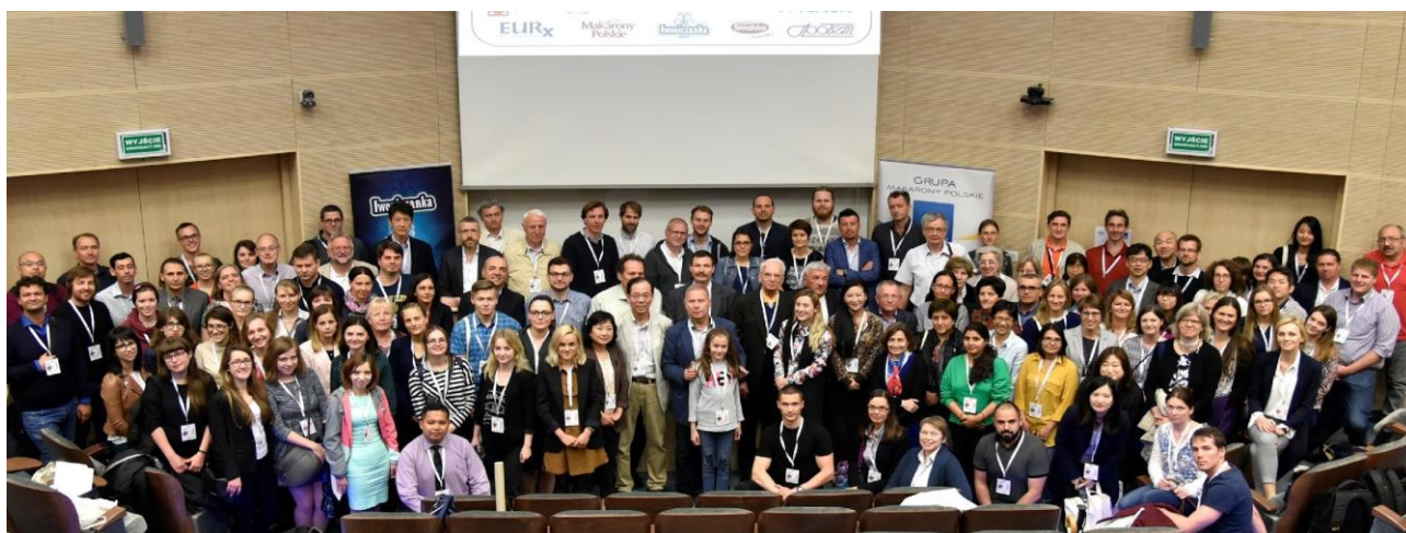
Фото 11. XII Міжнародний дріжджовий конгрес (м. Київ, 2008).