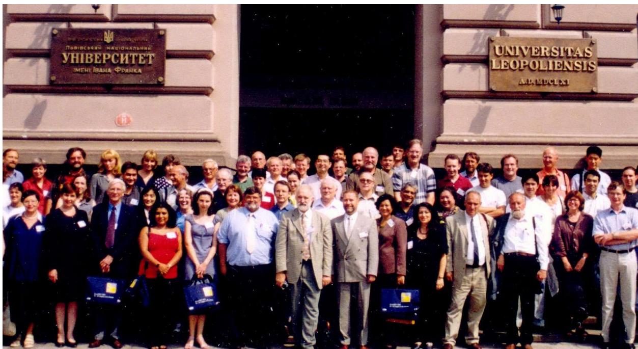
Фото 10 Міжнародний симпозиум з неконвенційних дріжджів (м. Львів, 2011).