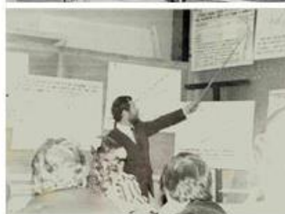
Фото 5. Захист докторської дисертації за спеціальністю «Генетика» у Ленінградському університеті (1986 рік).