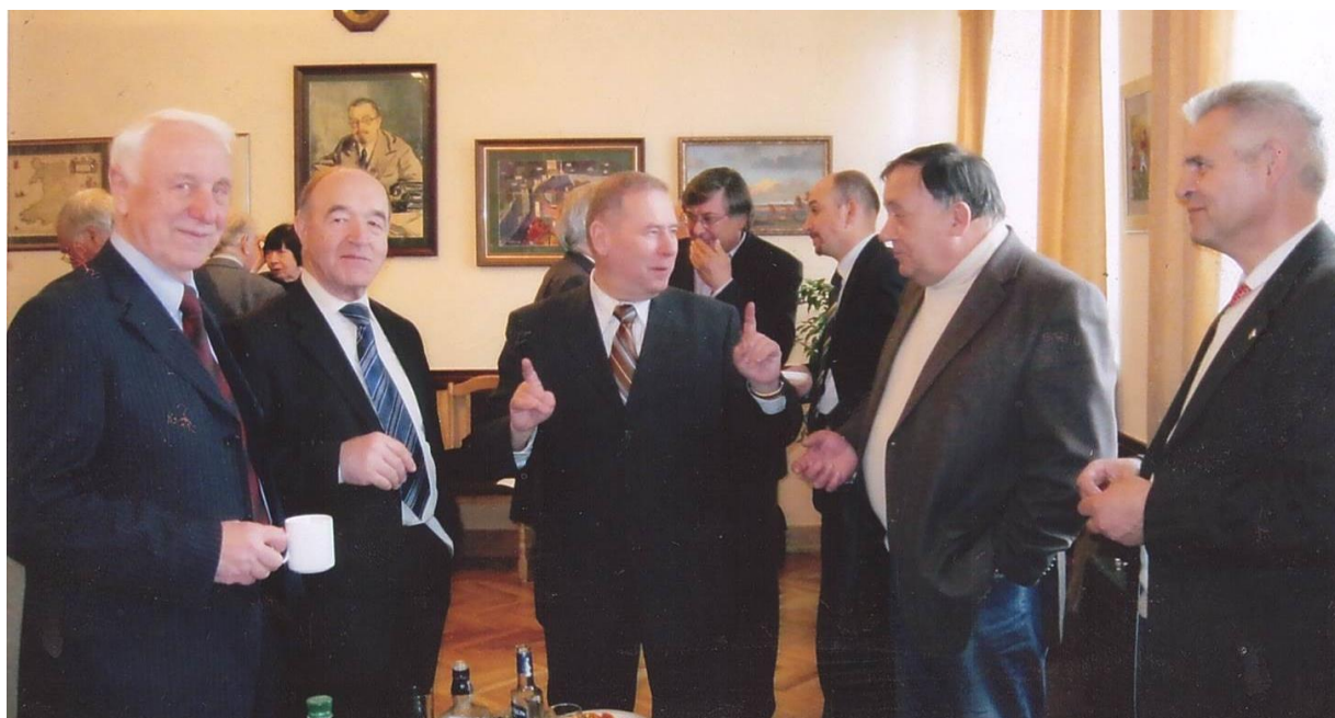
Фото 8. День обрання А. А. дійсним членом НАН України, 13 квітня 2012 р. Зліва направо: академік НАН України Підгорський В. С., член-кореспондент НАН України Сагач В. Ф., академік НАН України Сибірний А. А., академік НАН України Веселовський М. С., академік НАН України Чехун В. Ф.

Андрій Андрійович є відомим спеціалістом у галузі біології, зокрема, молекулярної генетики, клітинної біології та біотехнології дріжджів. Зусиллями А. А. Сибірного та його учнів створено добре знану у наукових колах школу «Молекулярні механізми регуляції метаболізму та гомеостазу органел у дріжджів». Школа виникла як логічне продовження досліджень біохімічних і генетичних механізмів регуляції синтезу низькомолекулярних сполук, зокрема біосинтезу флавінів у мікроорганізмів, які проводились під керівництвом учителя Сибірного А. А., доктора біологічних наук, професора Георгія Михайловича Шавловського. Роботами Сибірного А. А. та його учнів уперше виявлено явище азотної катаболітної інактивації (Shavlovsky, Sibirny, 1973), встановлено закономірності регуляції біосинтезу і транспорту рибофлавіну у дріжджів (Abbas S. A. Sibirny, 2011), ідентифіковано регуляторні гени флавіногенезу (Dmytruk et al., 2011). За допомогою методів метаболічної інженерії сконструйовано активні продуценти рибофлавіну, флавінових нуклеотидів (FMN, FAD) (Fedorovych et al., 2023; Fedorovych et al., 2021), а також вивчаються механізми дії регуляторних генів SEF1 та TUP1 у біосинтезі рибофлавіну (Andreieva et al., 2020). Вперше створено продуценти бактерійних антибіотиків (розеофлавін, амінорибофлавін) у дріжджів (Dmytruk et al., 2023).