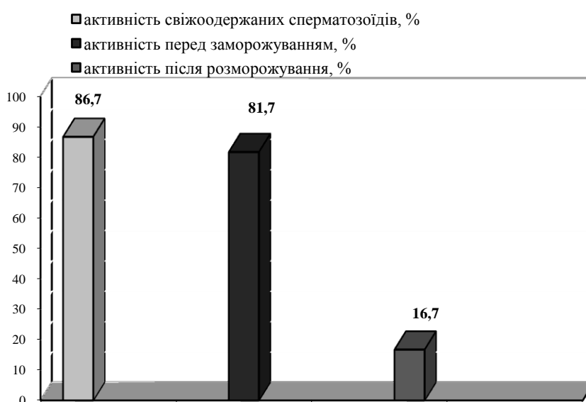
Рис. 3. Життєздатність еякульованих сперматозоїдів кнурів.

За результатами морфологічної та цитогенетичної оцінки встановлено (табл.), що 58,5 % ооцитів свиней відновили мейотичне дозрівання і досягли стадії метафази II мейозу в контрольній групі без додавання наноматеріалу.