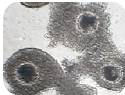
Рис. 2. ОКК, вилучені із яєчників свинок.

культивування проводили в середовищі, що містило 0,1 та 0,001 % наноматеріалу ВДК/БСА/Н-АНК і контрольну, в якій культивування ОКК проводили без додавання наноматеріалу. Критерієм морфологічної оцінки дозрівання ооцитів була наявність першого полярного тільця. Рівень дозрівання ооцитів in vitro вивчали шляхом аналізу цитогенетичних препаратів, які готували за модифікованим методом А. Тарковського [13, 14]. Препарати фарбували 2 %-ним розчином барвника Гімза й аналізували під світловим мікроскопом Jenaval, Carl Zeiss \text{ок}\times 10 , \text{об}\times 100 . Статистичну обробку одержаних даних проводили з використанням критерію Стьюдента.