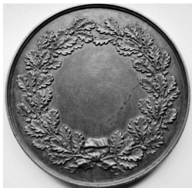
Рис. 5. Медаль Харківського товариства сільськогосподарства та сільськогосподарської промисловості (реверс).

У «Южно-русской сельскохозяйственной газете» було опубліковане оголошення, яке запрошувало для роботи на Харківській селекційній станції агрономів, котрі пройшли курс вищої школи і мають достатні практичні навички. Юр'єв надіслав заяву з проханням прийняти його на роботу, і професор П. В. Будрін зарахував його науковим працівником станції. З 1909 р. життя і діяльність В. Я. Юр'єва нерозривно пов'язані з Харківською селекційною станцією. П. В. Будрін і В. Я. Юр'єв одразу ж розгорнули активну роботу з вивчення, виділення і відбору кращих форм із популяцій та їх розм-