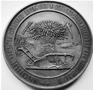
Рис. 4. Медаль Харківського товариства сільськогосподарства та сільськогосподарської промисловості (аверс).

рисунках 4 і 5 (64 мм, мідь, автор – Стадницький П., Російська імперія, 1887). За ініціативою товариства на кошти Департаменту землеробства і губернського земства у 1908 р. була створена Харківська сільськогосподарська станція, яка у 1909 р. була перейменована на Харківську селекційну станцію, а її першим директором став професор П. В. Будрін. До завдань станції входило вивчення та можливе покращення сільськогосподарських рослин [7].