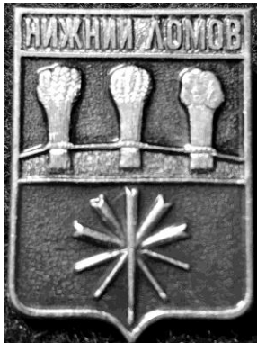
Рис. 1. Значок із гербом Нижнього Ломова (27x18 мм, алюміній, СРСР).

такі: матеріальна скрута, яку він постійно відчував, незважаючи на дворянське походження, та авторитет навчального закладу. Дійсно, навчання в цьому училищі було безкоштовним, учні забезпечувалися гуртожитком, була можливість підробляти. Крім того, Маріїнське земельне училище було одним із найкращих у Російській імперії. Можна згадати ще одного відомого вченого, який закінчив це училище на чотири роки раніше, ніж Василь, – Олександра Миколайовича Челинцева (1874–1962) – російського вченого, економіста-аграрника, чия діяльність була також частково пов’язана з Україною (викладання в Уманському середньому училищі садівництва та землеробства та Ново-Олександрійському інституті сільського господарства та лісівництва в Харкові, робота в Харкові). Після закінчення училища В. Я. Юр’єв вирішив вступити до Ново-Олександрійського інституту сільського господарства та лісівництва. Спонукали його, на наш погляд, ті ж причини – можливість влітку заробляти необхідні кошти в інститутському господарстві та авторитет інституту як одного із перших у Європі та Росії вищих сільськогосподарських навчальних закладів.