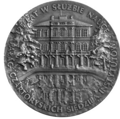
Рис. 2. Медаль до 125-річчя служіння науці палацу Чарторийських (аверс).

Інститут було засновано в 1816 р. в передмісті Варшави Марімонте (нині територія Жолібожа – району Варшави). У 1860-х роках заклад, який із приєднанням Варшавської лісової школи отримав найменування Інституту сільського господарства і лісівництва, був переведений у Ново-Олександрію (Люблінська губернія, Російська імперія, нині Пулави, Польща), де в 1869 р. його розмістили в колишньому палаці Чарторийських. Дуже цікавою є польська настільна медаль, присвячена 125-річчю служіння науці цього палацу (рис. 2, 3). На реверсі медалі (70 мм, бронза, Польща, 1987) є назва навчального закладу, про який ми розповідаємо.