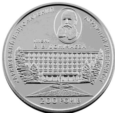
Рис. 6. Монета, присвячена 200-річчю Харківського національного аграрного університету імені В. В. Докучаєва (аверс).

сплав, створений методом порошкової металургії, Комбінат декоративно-прикладного мистецтва Ленінградського відділення художнього фонду РРФСР, СРСР. Єдине, що засмучує в цій цікавій медалі, це помилка скульптора у прізвищі вченого – «ЮРЕВ».