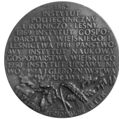
Рис. 3. Медаль до 125-річчя служіння науці палацу Чарторийських (реверс).

В. Я. Юр’єв успішно закінчив Інститут у 1905 р. і отримав звання вченого агронома. За відсутності інших варіантів він повернувся в Нижньоломівський повіт і влаштувався повітовим агрономом. Тяжкі картини голоду, розорення селянських господарств сприяли формуванню думок В. Я. Юр’єва про вирощування високих урожаїв, перебудову землеробства.