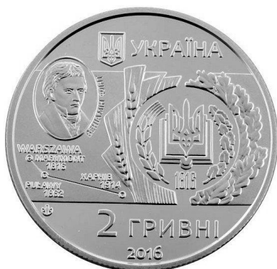
Рис. 7. Монета, присвячена 200-річчю Харківського національного аграрного університету імені В. В. Докучаєва (реверс).

1947 р. Василю Яковичу було присуджено Сталінську премію СРСР. Учений передав отримані кошти до фонду відбудови народного господарства. На цей час Юр'єв був директором Інституту генетики та селекції АН УРСР, який було засновано Президією АН УРСР 21 грудня 1945 р. Фактична діяльність інституту почалася 1 липня 1946 р. У 1956 р. на базі Інституту генетики та селекції АН УРСР і Харківської державної селекційної станції створений Український науково-дослідний інститут рослинництва, селекції та генетики Міністерства сільського господарства УРСР. Після смерті Василя Яковича в 1962 р. інституту було присвоєно його ім'я. Нині це Інститут рослинництва ім. В. Я. Юр'єва НААН України.