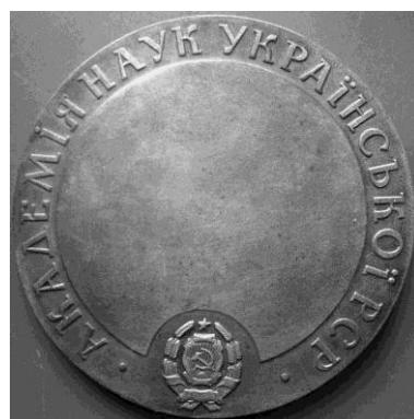
Рис. 9. Настільна медаль на честь академіка Юр'єва (реверс).

Пошта України випустила у 1998 р. художній маркований конверт (ХМК), присвячений В. Я. Юр'єву (рис. 10).