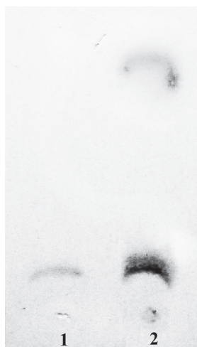
Рис. 2 Тонкошарова хроматограма ендогенних пігментів досліджуваних дріжджів, екстрагованих етанолом (1), ацетоном (2)

Методом ТШХ показано, що хроматографічна рухливість (Rf) рожевого пігменту в обох випадках становила 0,21, а оранжевого - 0,95. Отже, досліджувані дріжджі при культивуванні на сусло-агарі накопичують два неполярні каротиноїди рожевого і оранжевого забарвлення.