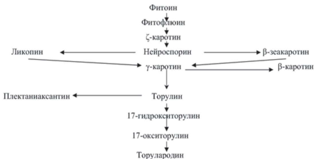
Схема 1. Шлях синтезу каротиноїдних пігментів у дріжджів [3]

тичних речовин. Ймовірно, що в даному випадку продукування каротиноїдів є механізмом захисту від дії іонів токсичних металів. Раніше співробітниками нашого інституту була показана пряма залежність між наявністю каротиноїдних пігментів і стійкістю до високих концентрації іонів міді [4]. З іншої сторони, виділені дріжджі, крім каротиноїдних пігментів, можуть мати еволюційно доскональну систему репарації, наявність якої дає змогу існувати в даних умовах.